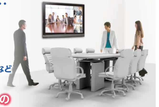
ビデオ会議ソリューションでワークスタイルを改革!